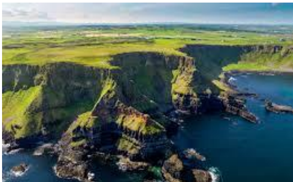
Irlanda- 1 escola, 1 destino