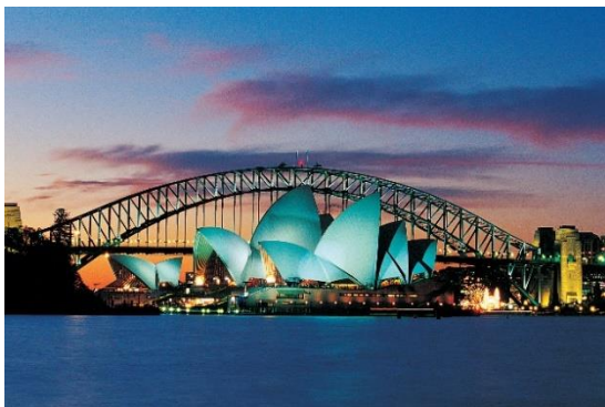
Austrália- 6 escolas, 5 destinos