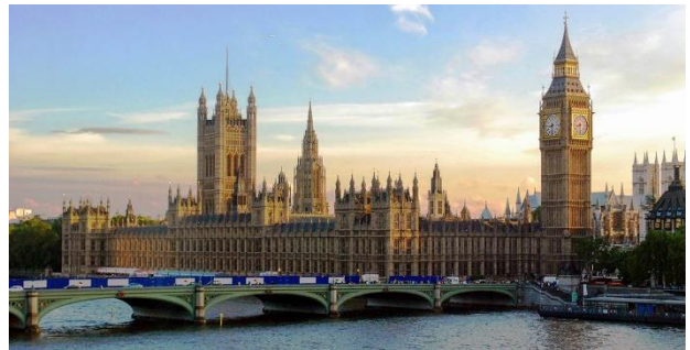
Reino Unido- 10 escolas, 9 destinos