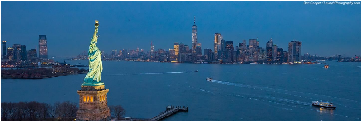
Estados Unidos- 20 escolas, 15 destinos