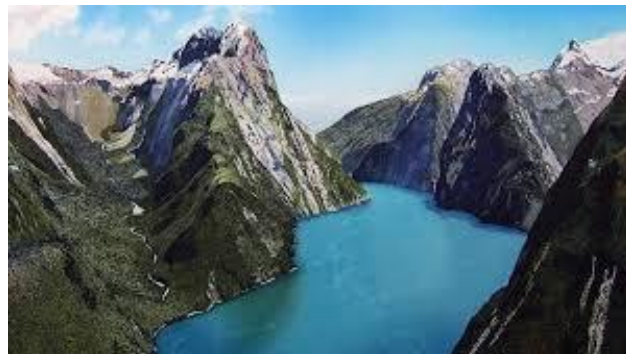
Nova Zelândia- 1 escola, 1 destino