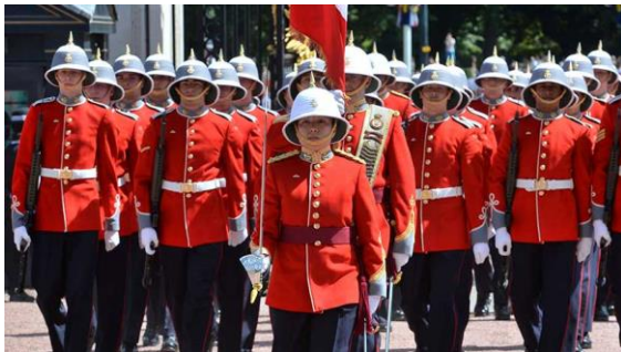
Canadá- 2 escolas, 2 destinos