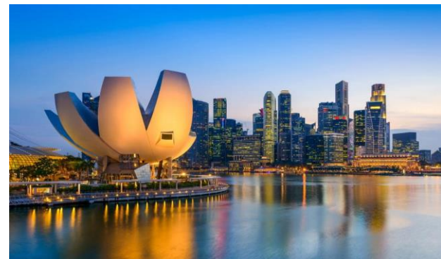
Cingapura- 1 escola, 1 destino